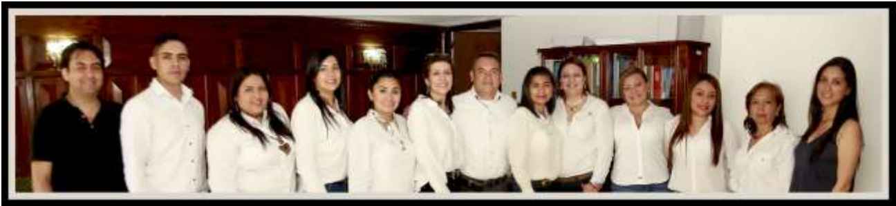
Equipo Secretaría Técnica OCAD Cauca

Periodo comprendido entre el 01 de Enero de 2018 y el 30 de Junio de 2018.